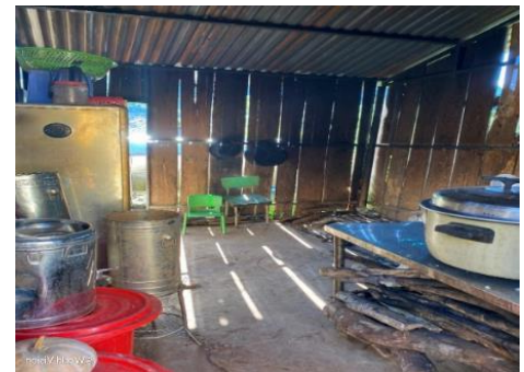
Cơ sở nấu ăn của trường mẫu giáo là nơi được hỗ trợ