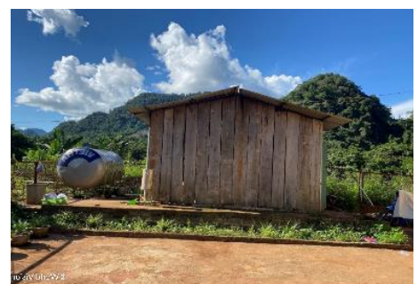
Cơ sở nấu ăn của trường mẫu giáo là nơi được hỗ trợ (Khung cảnh bên ngoài)