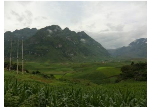
Hình ảnh khung cảnh của địa điểm thực hiện chương trình ở huyện Tuần Giáo

Trong tầm nhìn 10 năm của Tập đoàn Morinaga Milk Industry đã đặt mục tiêu đạt “tỷ lệ doanh thu nước ngoài từ 15% trở lên” trước khi kết thúc năm tài chính vào cuối tháng 3 năm 2029. Chúng tôi đã thiết lập cơ sở sản xuất và kinh doanh tại Việt Nam vốn là một trong những quốc gia được chú trọng trong việc phát triển kinh doanh ở nước ngoài của chúng tôi. Ngoài ra, chúng tôi cũng mong muốn được chung tay trong việc giải quyết vấn đề sức khỏe và dinh dưỡng của địa phương để thực hiện việc “Đóng góp cho sức khỏe” trong chiến lược “Thực phẩm và sức khỏe (góp phần nâng cao sức khỏe của 300.000.000 người)* 4 bằng cách mang lại các giá trị chất lượng cao chỉ có ở Tập đoàn